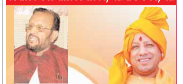
माननीय श्री सुरेश खन्ना जी नगर विकास मंत्री, उ.प्र. सरकार। माननीय श्री आदित्यनाथ योगी मुख्यमंत्री, उत्तर प्रदेश

स्वतंत्रता दिवस 15 अगस्त, 2018 के शुभ अवसर पर नगर पालिका परिषद नगर वासियों को हार्दिक बधाई देते हुए मंगलमस्त होने की कामना करती है और उनसे अपील करती है कि-