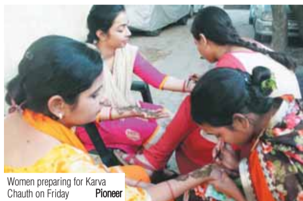
Women preparing for Karva Chauth on Friday.