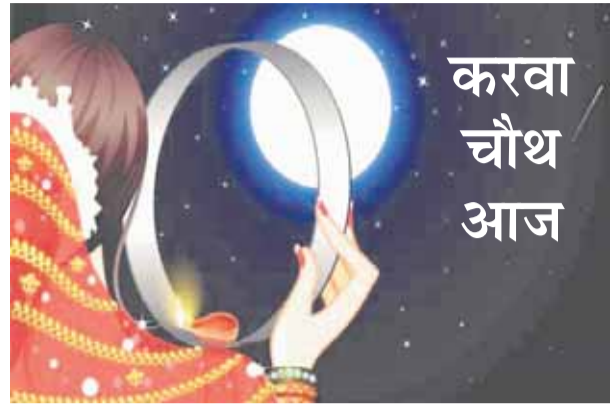
करवा चौथ आज